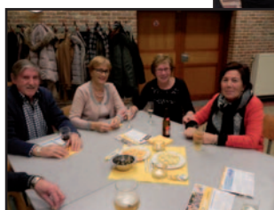
Het was een bijzonder gezellige avond.