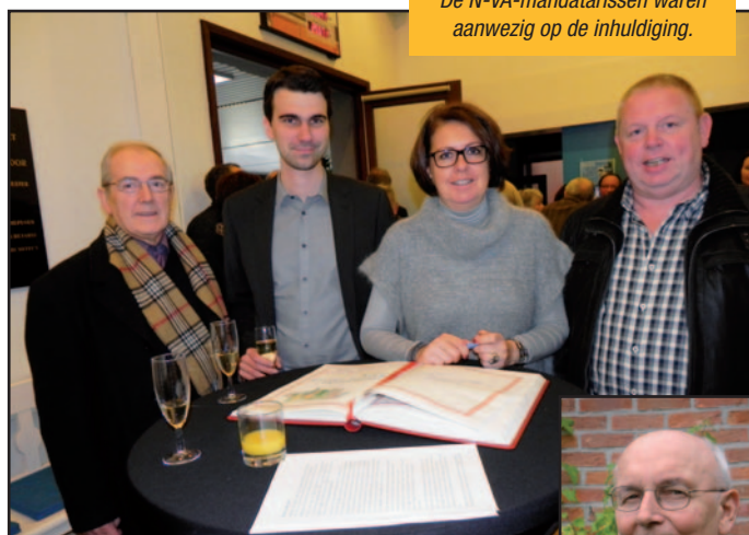
De N-VA-mandatarissen waren aanwezig op de inhuldiging.