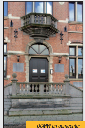
OCMW en gemeente: voorlopig nog twee deuren, maar niet voor lang meer.

De uitdaging is de komende jaren hieraan verder extra energie te besteden. De basis hiervoor is trouwens al gelegd, nu de plannen er zijn voor de bouw van een nieuw administratief centrum in Berlaar. In de voorbereiding naar een gedeelde campus leerden we dat de werking van een gemeente best omschreven kan worden als een goed geoliede fabriek die bandwerk aflevert met een sterke focus op resultaten. Het OCMW daarentegen beschouw ik meer als een familiebedrijf dat maatwerk biedt naargelang de behoefte van de cliënt. Beide delen wel één visie: de burger staat voorop!